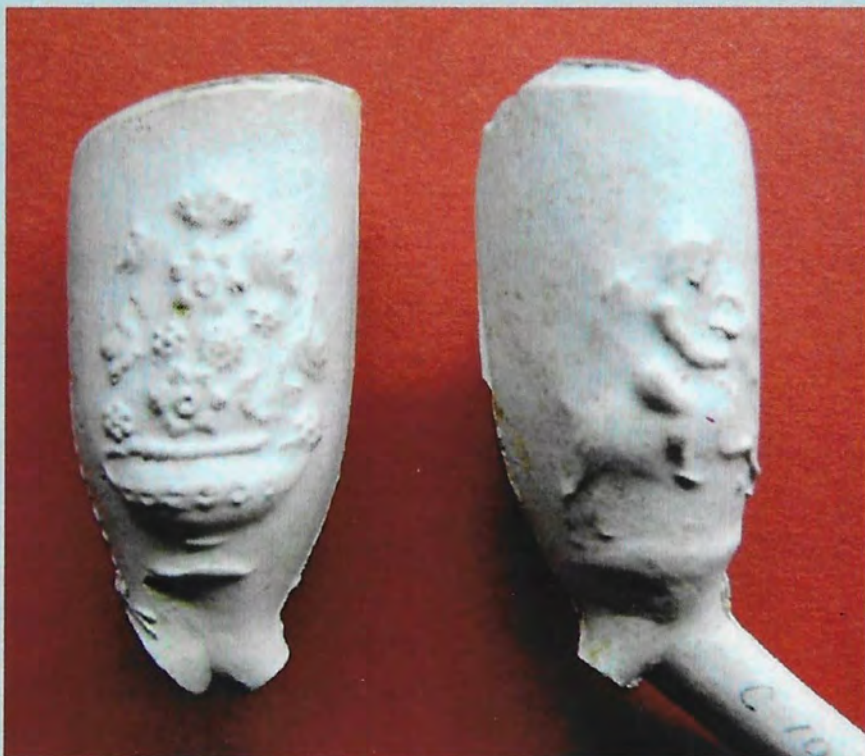
Gorkumse pijpenkop met een bloempot en putti. Zie artikel op pagina 2244