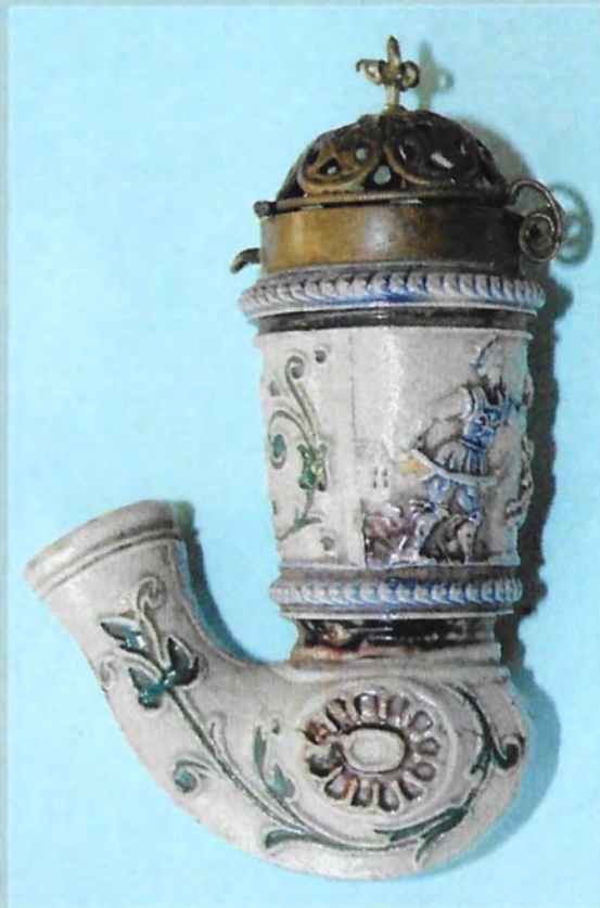
Linker en rechter zijde van steengoedpijp. Voor beschrijving zie colofon.